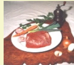
Suppenfleisch durchwachsen und mager ( cirka 4 x 350g )