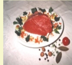
Braten (auch für Geschnetzeltes ) (cirka 3 x 750g )