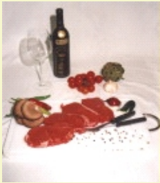
Rumpsteak ( 2 x 2 Stück )