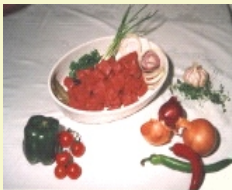
Gulasch ( 3 x ca. 500g )