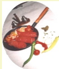
Rouladen ( 2 x 2 Stück )