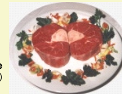
Beinscheibe ( 1 x groß oder 2 x klein )