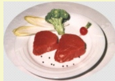
Filetsteak ( 1 x 2 Stück )