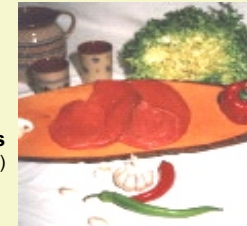
Weide – Steaks ( cirka 2 x 2 Stück )